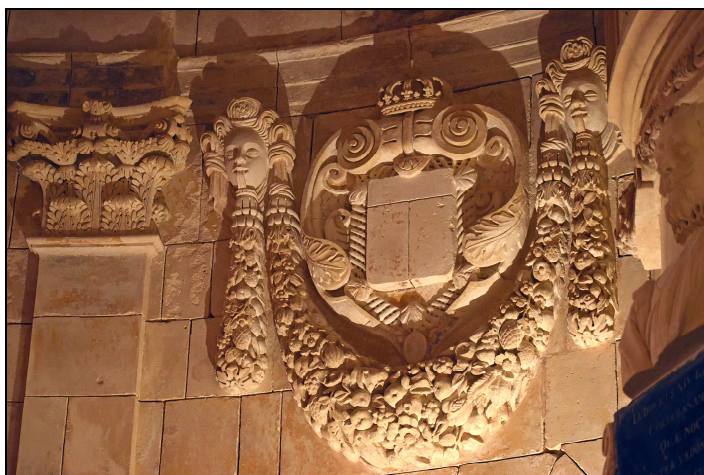
Mise à nu des sculptures par le retrait des couches de peinture. À droite, dans l'ombre, le buste de Louis de Foix.