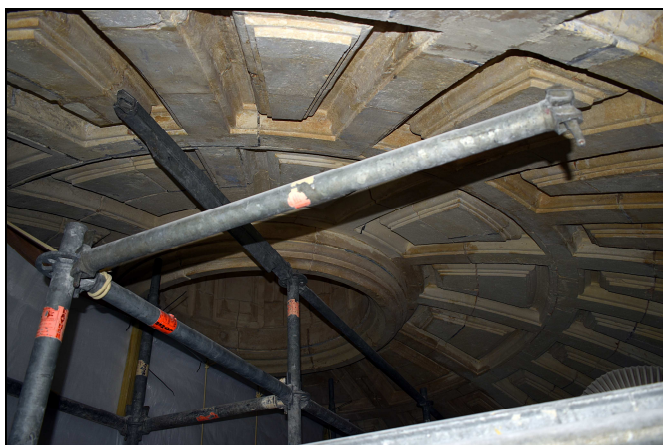
Structure métallique servant d'échafaudage au-dessus de l'autel.