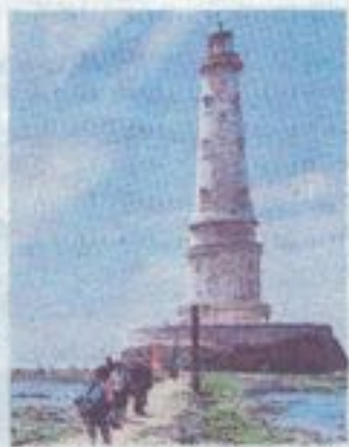
Le phare a reçu un avis positif du comité français du patrimoine mondial.