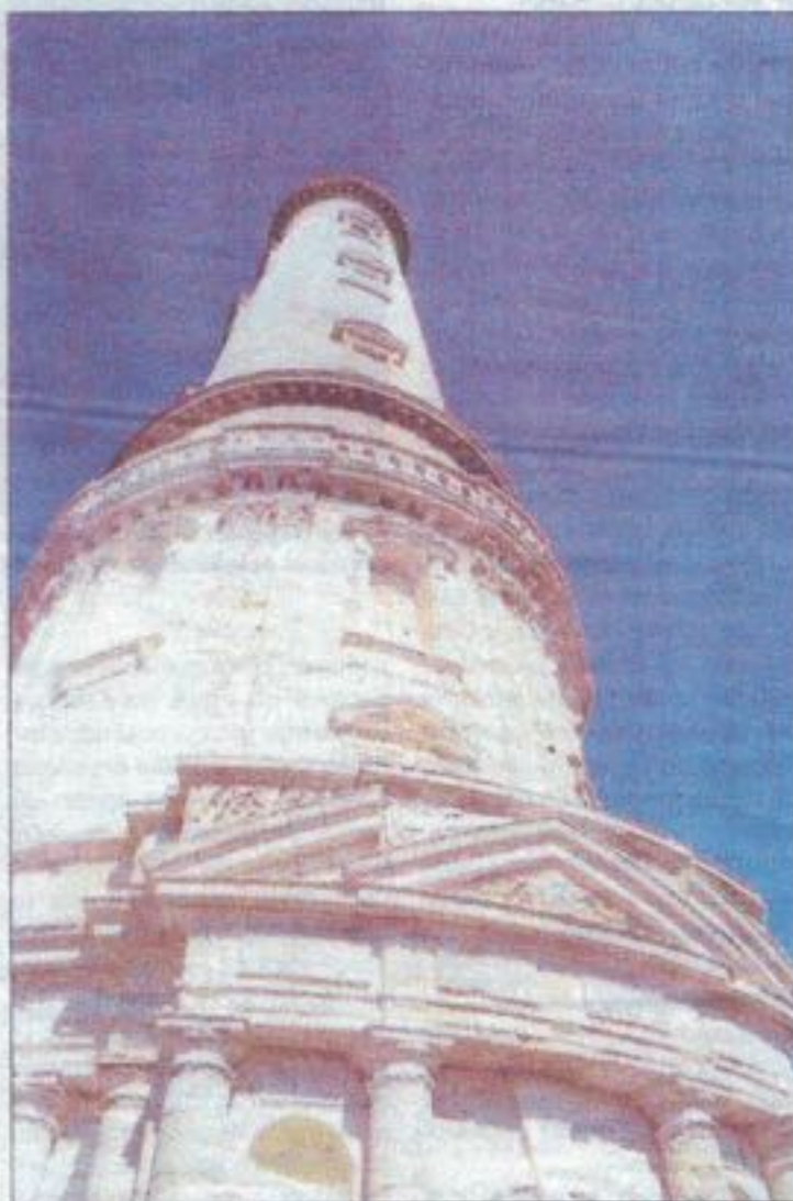
La mobilisation pour l'inscription du phare au Patrimoine mondial de l'UNESCO continue.