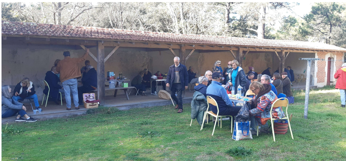
Une vue des participants au moment du repas, un moment de convivialité toujours apprécié.