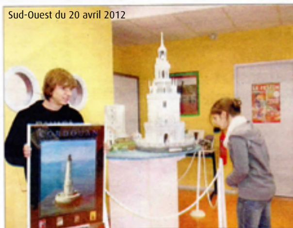
La maquette de Jean-Guy Célador a permis aux lycéens de découvrir le phare de Cordouan, lors de sa construction initiale du XVIII e siècle.

LESPARRE Le lycée a accueilli la maquette du phare, représentant le monument tel qu'il était au XVIII e siècle