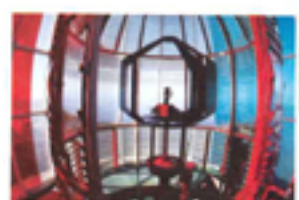
Situé à l'embouchure de l'estuaire de la Gironde, le phare de Cordouan est parfois appelé le « Versailles de la mer », le « Phare des rois » ou encore le « Roi des phares »...