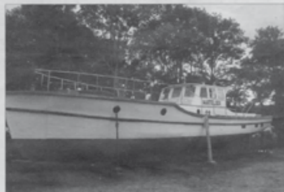
La vedette « Matellier » est en cours de restauration.

L'Association pour la sauvegarde du phare de Cordouan organisait, samedi 4 août, le vernissage de l'exposition bien nommée « Ph'Art », dans les salles du rez-de-chaussée du phare de Grave. Un édifice caché depuis les voies de circulation de la pointe de Grave et dont il faut chercher les panneaux directionnels pour le rejoindre.