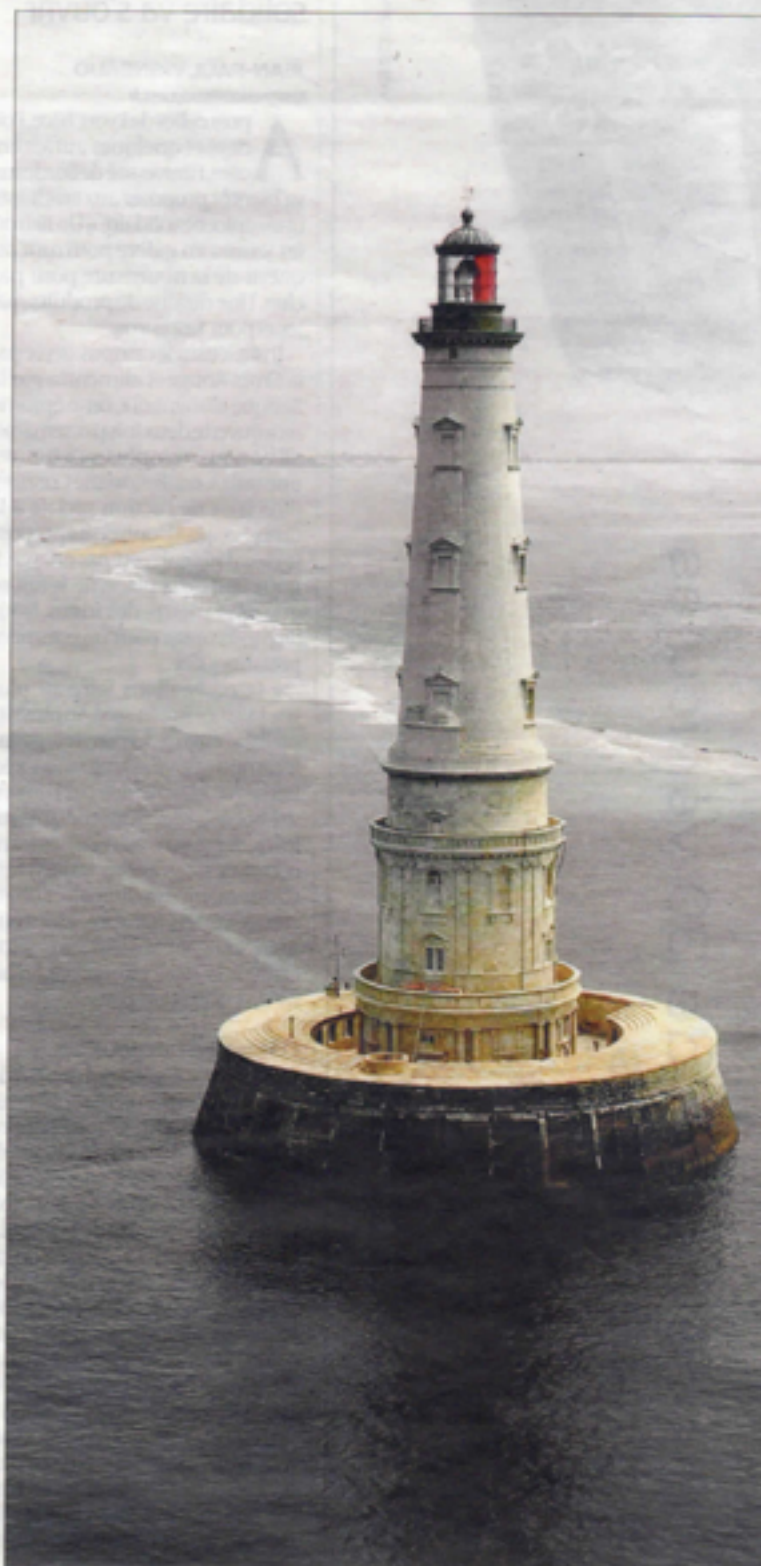
Grâce au site Internet, le phare se visite même en hiver.