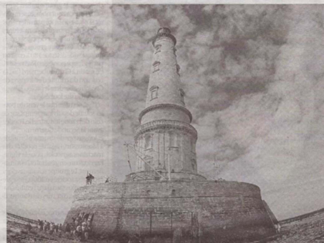
Le phare devrait accueillir en résidence le photographe Jean Gaumy de l'agence Magnum.

En clair, pour le Smiddest, il n'est pas question de laisser penser ou dire qu'après cette relève il n'y aura