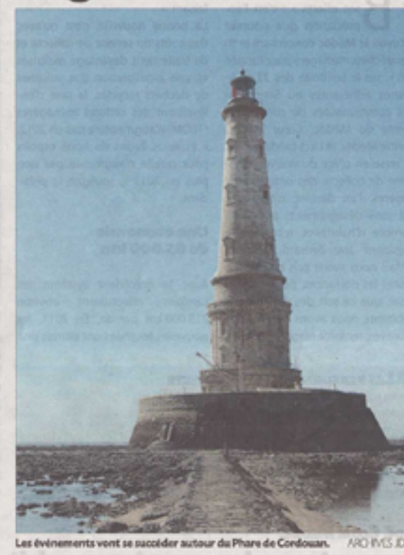
Les événements vont se succéder autour du Phare de Cordouan. ARO IVES JON.

nouvelles recettes. Pour mener à bien toutes ces missions, un chef de projet a été embauché à mi-temps pour une durée de neuf mois. Concernant la visite du Phare de Cordouan, les transporteurs agréés sont chargés de vendre les tickets d'entrée, qui connaissent une restructuration tarifaire. Le comité syndical du 26 janvier à Pauillac a décidé de passer le ticket adulte à 6 € en supprimant la redevance de débarquement. Le prix n'augmentera donc pas pour le visiteur qui payait son ticket 5 € en plus de la redevance à 1 €. Le tarif réduit pour les moins de 12 ans reste à 2,50 €. De plus, chaque ticket sera daté du jour pour contrôler les quotas alloués. Le nombre de visiteurs autorisés par marée reste à 220, dont 100 par rive et 20 « autres ».