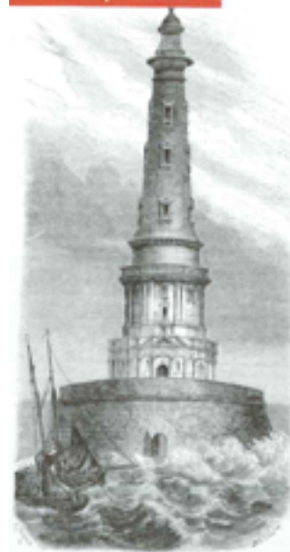
Le phare de Cordouan, à l'embouchure de la Gironde.