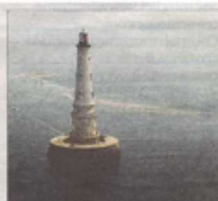
Optimiser la gestion du phare.