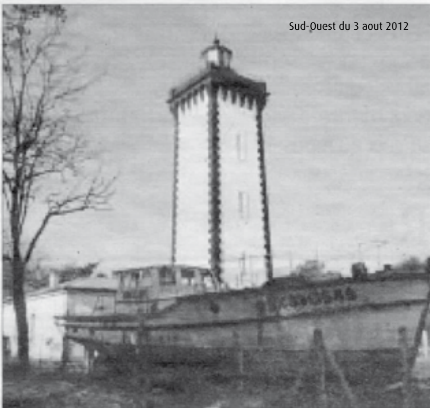
Ce soir, panorama de nuit depuis le phare de Grave.

Du haut des 108 marches du phare de Grave, au Verdon, la vue est à couper le souffle : le phare de Cordouan, la côte royannaise, l'estuaire, les plages médocaines se déploient à 360°.